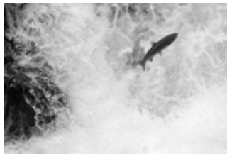
Lõhe oma loomulik elukeskkonnas

Esimene pais asub 10 km kaugusel jõe suudmest Joaveskil. 50% koelmualadest asuvad ülalpool Joaveski paisu. Lisaks kättesaamatutele koelmualadele on probleemiks hüdroloogiline režiim allpool Joaveski paisu.